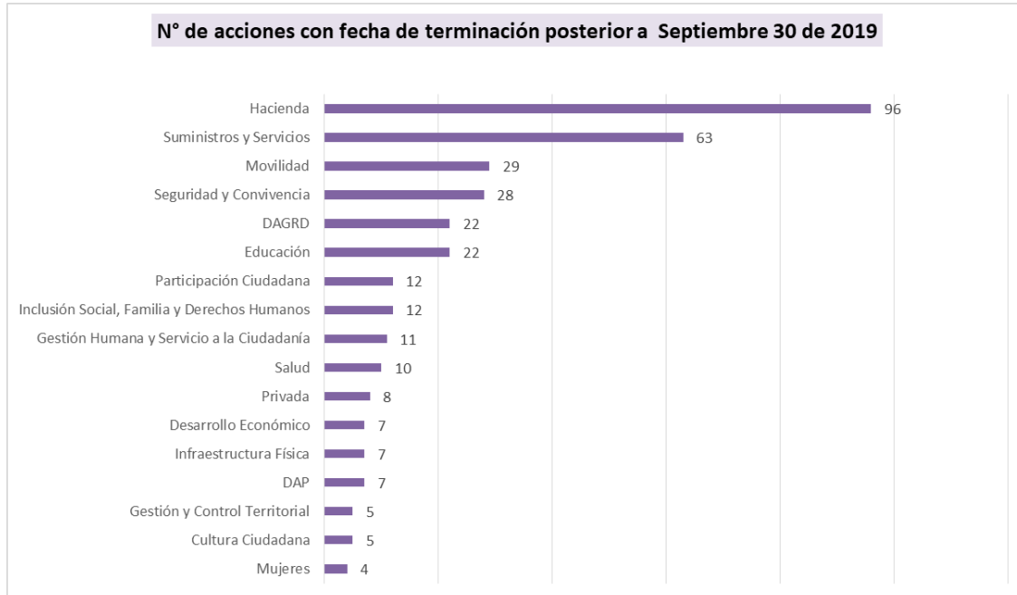
Gráfico 3. Cantidad de acciones de mejoramiento con fecha de terminación posterior al corte evaluado